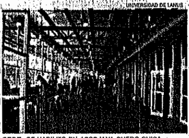
SEDE. SE HABILITO EN 1999 Y YA QUEDO CHICA.

La UNLa fue creada en 1995 por la Ley 24.496 y comenzó a funcionar dos años después con diez aulas. En 1999 inauguró el edificio Scalabrini Ortiz, en 29 de Septiembre 3901, Remedios de Escalada. Hoy tiene 8.500 alumnos, el 70% proveniente de escuelas públicas. Dicta 28 carreras de grado divididas en cuatro departamentos (Salud Comunitaria, Humanidades y Artes, Planificación y Políticas Públicas, y Desarrollo Productivo y Trabajo) además de 13 posgrados. Este año se incorporan dos nuevas licenciaturas; Seguridad